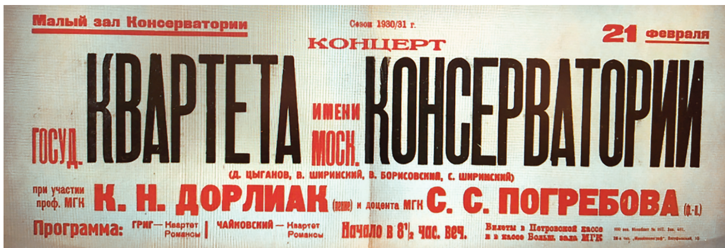
илл. 3. Афиша концерта квартета МГК при участии К.Н. Дорлиак и С.С. Погрёбова в Малом зале. 21 февраля 1931 года. Российский национальный музей музыки (далее — РНММ) [14]

времени в Москву. Однако московский период творчества певицы продлился недолго по причине, указанной выше (см. илл. 3).