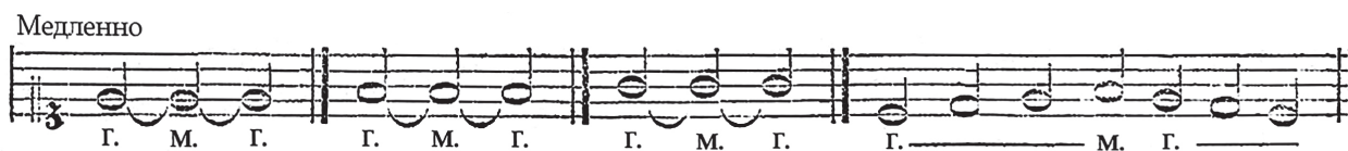
рис. 4. Расшифровка исполнения истинного итальянского portamento [9, с. 20]