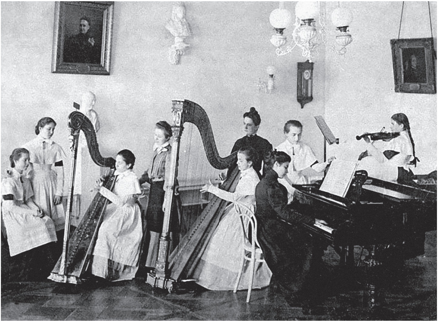
илл. 2. Урок музыки в Смольном институте. Из выпускного альбома 1889 г., РГАКФД [13]

начавшись ещё в годы обучения в консерватории (примерно с 1907 г.), они продолжались вплоть до 1914 года, существуя параллельно с оперными ролями, а с 1920 по 1938 гг. заняли главное положение в творчестве артистки. И хотя она отдала им больше четверти века, именно данная сторона её деятельности, как ни странно, до сих пор остаётся наименее изученной.